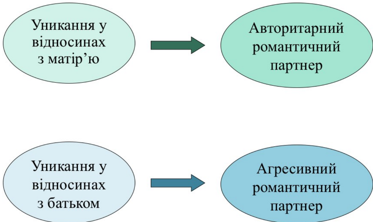
Рисунок 3. Взаємозв'язок особливостей взаємодії з батьками та вибору романтичного партнера

Нез'ясованими в даному дослідженні лишаються питання чи є відмінності між юнаками та дівчатами в тому, як відносини з кожним з батьків впливають на якість їх прив'язаності до романтичного партнера і чи залежить цей зв'язок від структури батьківської сім'ї.